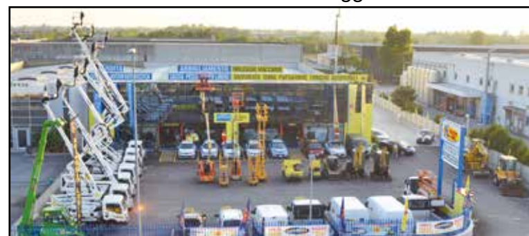
La nuova sede della Noleggio Lorini in zona industriale, via E. Montale 15.

SEDE: MONTICHIARI (BS) - Via E. Montale, 15 FILIALI: CALCINATO - CASTEGNATO tel. 030.9650556 - www.noleggiolorini.com