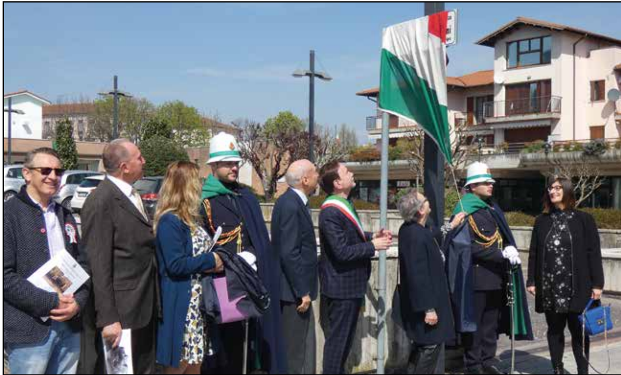
Inaugurazione della nuova targa Piazza Senatore Mario Pedini.

Montichiari: scompare Piazza Municipio, ecco Piazza Senatore Mario Pedini