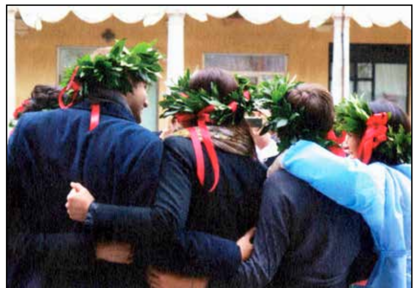
La gioia di gruppo per un primo importante traguardo.