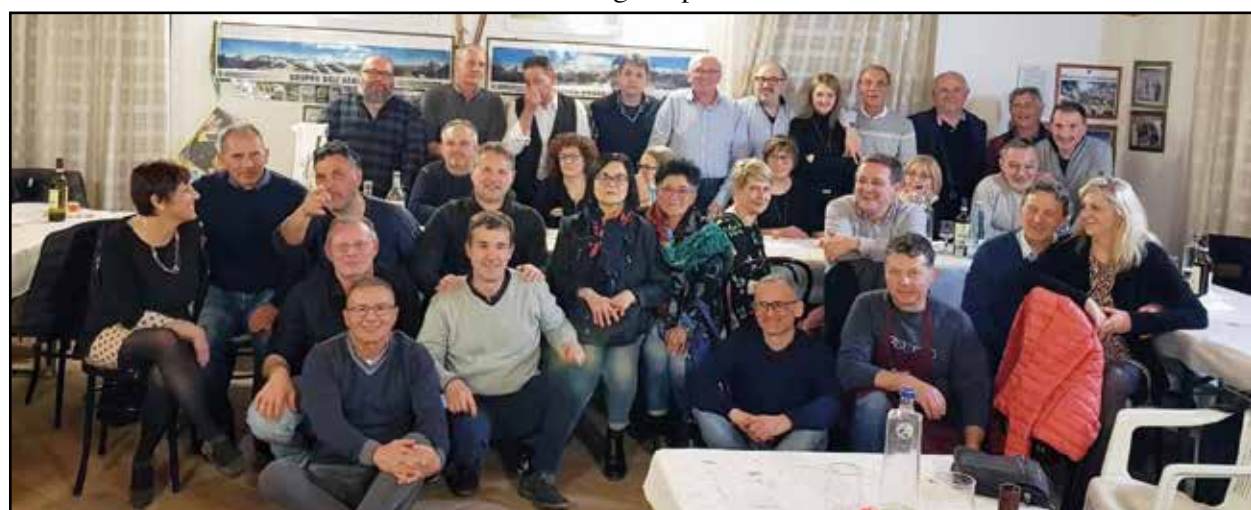
Foto ricordo degli intervenuti presso la sede degli Alpini.

partecipazione di 49 "Leopardesi", rimasti soddisfatti del menù e per aver trascorso in compagnia una piacevole serata.