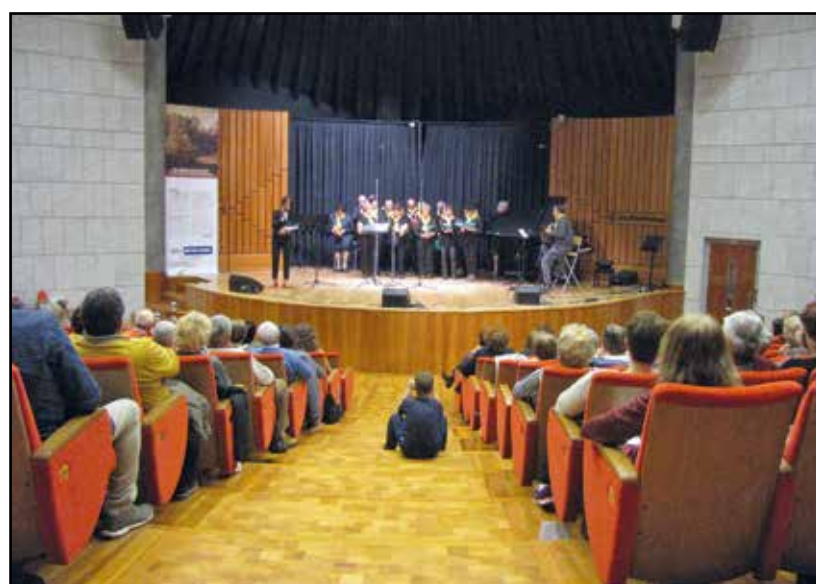
L'esibizione di uno dei cori partecipanti alla rassegna.

Al pomeriggio di spettacolo hanno partecipato circa 250 ospiti, che hanno potuto apprezzare varie esibizioni sia di artisti professionisti a livello nazionale, sia di cantanti amatoriali che, tuttavia, hanno interpretato la musica con straordinaria passione. Ascoltata, cantata o improvvisata la musica è una vera e propria cura dell'anima. Il Gardaforum si è confermato, ancora una volta,