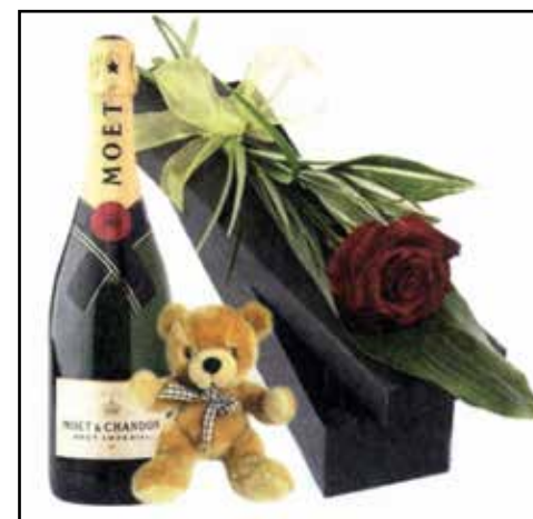
Un brindisi per un futuro incerto.

La situazione non si rivela essere così tragica chiaramente: quella subito susseguente alla laurea è una fase che dura qualche mese e poi quasi tutti, con un po' di difficoltà, cominciano a farsi strada nel mondo del lavoro, con un po' di fortuna anche con grandi soddisfazioni, senza dover ne-